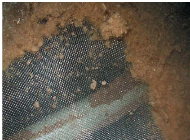
Рис. 1: Материал для просеивания: древесная пыль и волокна в сочетании с крупномерными отходами

Учитывая вышеизложенное, чтобы обеспечить отсортировку тонкодисперсных частиц, а также избежать засорения ячеек, требуется создать быстрое вращательное движение, сообщив грохоту значительно более высокое ускорение. Это ускорение создается только в грохотах прямого возбуждения, например, в грохотах Mogensen Sizer 2000.