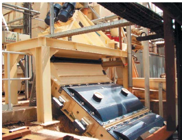
Рис. 3: Система грохочения с подачей материала непосредственно в установку Sizer 2000

Габаритные размеры установки: ширина – 2000 мм; длина – 3000 мм. Рама поделена в ширину пополам так, что монтируются два сита шириной 1 м каждое. Это значительно облегчает замену сит в случае повреждения или износа, когда достаточно сменить только испорченную часть. Разгрузочный бункер превосходит по объему аналогичный