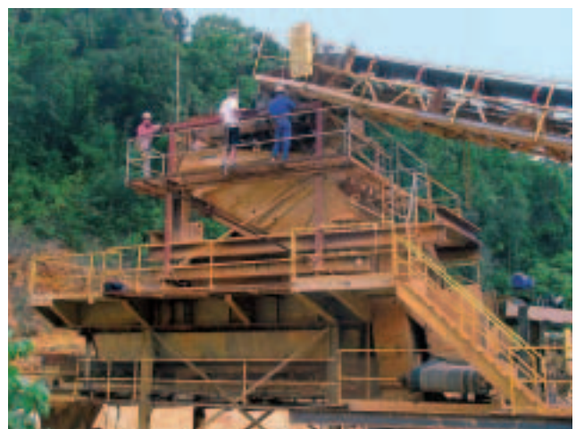
Bild 3: Siebanlage mit eingebautem Vibro-Stangensizer in Puerto Rico

The processing plant is located in the north of the island, where extensive deposits of limestone can be found. The limestone, however, is not deposited in pure form as solid rock, but as loose material with a high percentage of fines and clay and loam impurities. Because the material comes direct from the quarry, its moisture content varies depending on the weather conditions. On account of the climatic conditions in Puerto Rico, frequent and heavy rainfall but also long dry periods have to be expected.