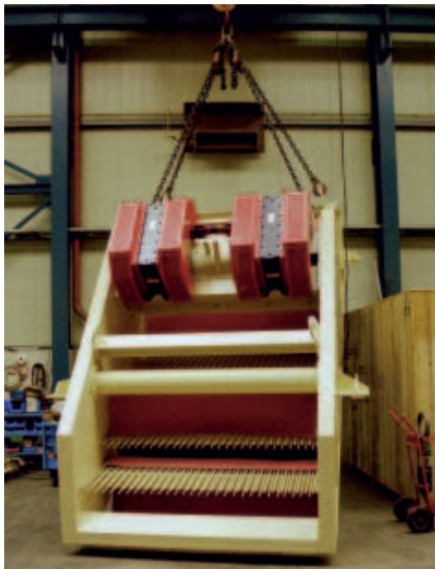
Bild 4: Der Vibro-Stangensizer Typ VX 2088 vor Auslieferung Fig. 4: The VX 2088 Vibratory Bar Sizer prior to shipment

Nach der Inbetriebnahme waren nur geringe Arbeiten zur Optimierung der Maschine notwendig. Trotz eines selbst für die Region sehr regenreichen Winters erfüllt die Anlage die in sie gesetzten Erwartungen. Wetterbedingte Einflüsse unterbrechen nicht mehr den Betrieb, und die Produktion kann in vollem Umfang ohne große Einbußen bei den Qualitätsanforderungen aufrechterhalten werden. Die Abraummenge konnte durch den Einsatz des Vibro-Stangensizers wesentlich reduziert werden. Ein übermäßiger Verschleiß war bisher nicht zu beobachten. Weitere Maschinen sollen in Zukunft auch in anderen Werken des Betreibers eingesetzt werden.