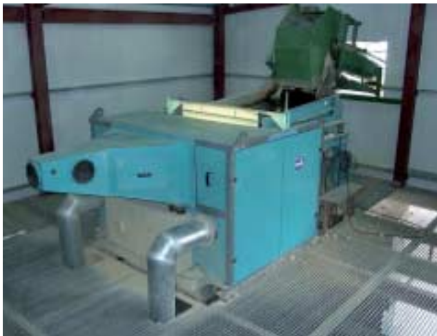
Bild 1: MikroSort AT. Optischer Sortierer für Gesteinssortierung, ausgerüstet mit zwei Farbkameras für eine zweiseitige Betrachtung