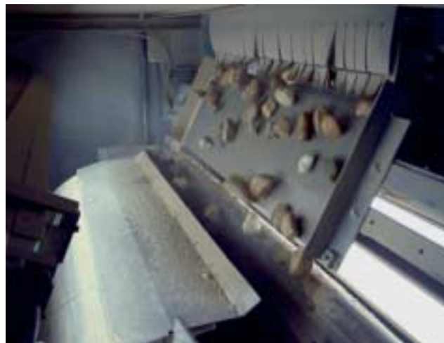
Bild 2: Die Quarzkiesel werden auf der Rutsche beschleunigt und unterhalb der Rutschenkante von zwei Farbzeilenkameras gescannt