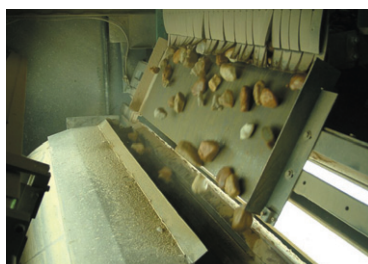
Photo 2 Les galets de quartz prennent de la vitesse sur le toboggan et sont analysés juste sous l'arête par les deux caméras couleur linéaire.

Des carrières situées dans le nord-ouest de l'Espagne exploitent un gravier de construction à très forte teneur en \text{SiO}_2 . La granulométrie de ce gravier est comparable à celle exigée pour l'élaboration du silicium. Les teneurs critiques en fer, aluminium et titane sont considérablement réduites par l'utilisation d'une machine de tri optique [1-3]. Des tests comparatifs ont montré que pour obtenir d'aussi bons résultats, il faudrait sept personnes triant à la main.