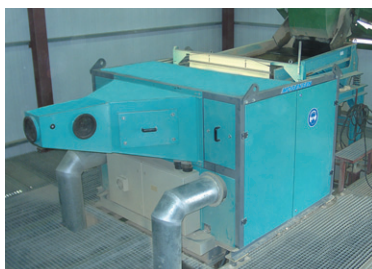
Photo 1 MikroSort® AT. Machine de tri optique de galets, équipée de deux caméras couleur pour une observation bi latérale

RÉSUMÉ Les producteurs de silicium sont en forte demande de galets de quartz contenant le minimum d'impuretés métalliques car ils constituent la charge optimale des fours de fusion. Le présent article décrit comment réduire de manière significative cette teneur en impuretés métalliques en utilisant un système optique de tri automatique des galets de quartz en fonction de leur couleur et de leur brillance. Le système présenté ici traite 60 t/h de galets quartz de granulométrie 30 à 100 mm.