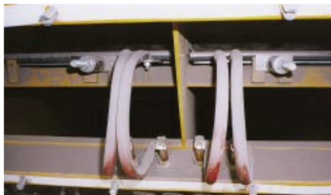
Bild 2: Siebbelagheizung des Mogensen Sizer 2000 Fig. 2: Screen deck heating in the Mogensen Sizer 2000

The rocking movement of the rapping bar is controlled by a vibration system operating in the resonance range, which allows easy adjustment of the impact force to requirements of the specific screening application. This enables a variable acceleration between 10 and 30 g. If the material to be classified still sticks at an acceleration of 30 g, a periodically recurrent cleaning phase with an acceleration of 50 g can be programmed [1]. As lava stone in the fines range with its high moisture contents is classed as particularly difficult-to-screen, the screening system is also assisted by electric heating of the screen panels (resistance heating)