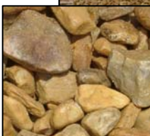
Quarz mit hohem Eisengehalt