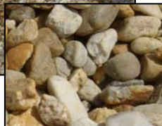
Quarz mit geringem Eisengehalt