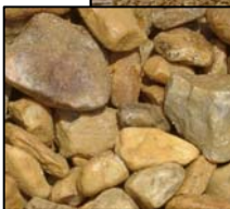
Quarz mit hohem Eisengehalt